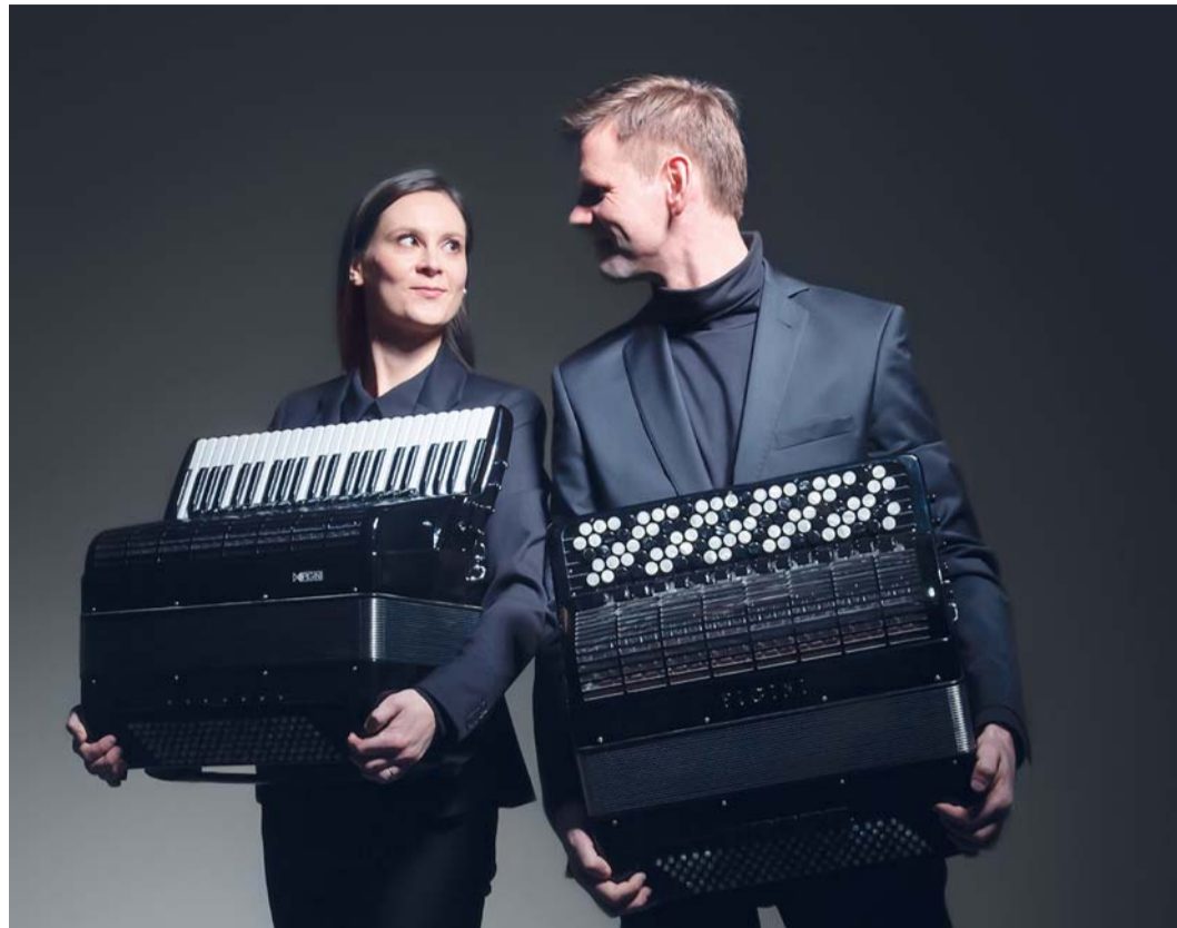
Na Forfestu se dostane i na méně obvyklé tóny a nástroje. Vystoupí zde například slovensko-polské akordeonové Duo Accosphere.

Kromě toho festival – nad kterým má záštitu mj. arcibiskup Jan Graubner – zahrne 22 kon-