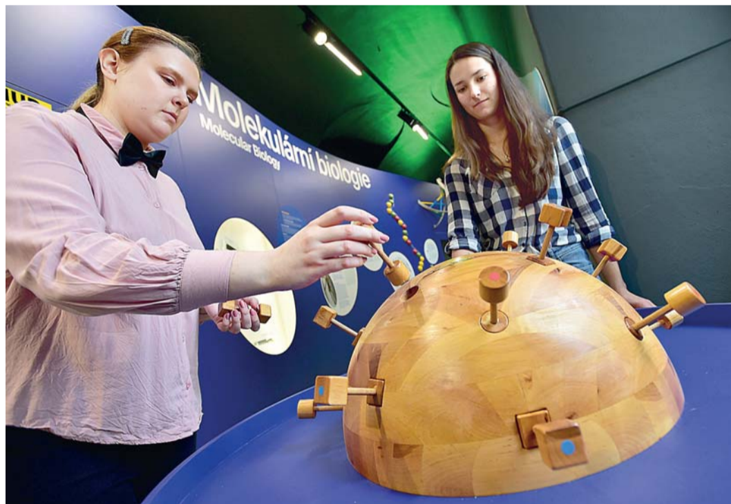
Dotýkat se je dovoleno – je nepsaným heslem nové mendelovské expozice.

Muzeu (které se nachází v augustiniánském klášteře v Brně, kde badatel žil a pracoval) doplnila výstava stávající okruh Gregor Johann Mendel – příběh skromného génia. Zaměřuje se na život a osobnost někdejšího augustiniánského opata a vedle životopisných údajů nebo jeho osobních věcí si tu návštěvník může zkusit třeba třídít hrách podle barvy zrněk, jako to během svého devítiletého experimentu dělal sám objevitel. Vypěstoval při něm neuvěřitelných 27 tisíc rostlin hrachu! Nová expozice pak cílí právě na jeho pokusy, objevy i objasnění principů dědičnosti běžným návštěvní-